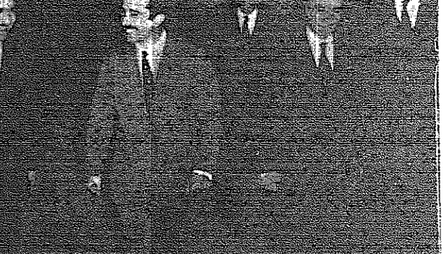
سمو الامير محمد لدى وصوله الى مطار عمان واستقباله سمو الامير حسن ودولة رئيس الوزراء وسيد سعادة الشريف حسين بن ناصر رئيس الديوان الملكي

سمو الامير محمد عاد من أوروبا مساء امس عمان - عاد الى عمان مساء امس سمو الامير محمد قائدا من أوروبا بعد زيارة خاصة استغرقت بضعة ايام. وكان في استقباله بمطار عمان سمو الامير حسن نائب جلالة الملك والي العهد العظيم ودولة السيد بهجت الفهري رئيس الوزراء وسيد سعادة الشريف حسين بن ناصر رئيس الديوان الملكي الهاشمي.